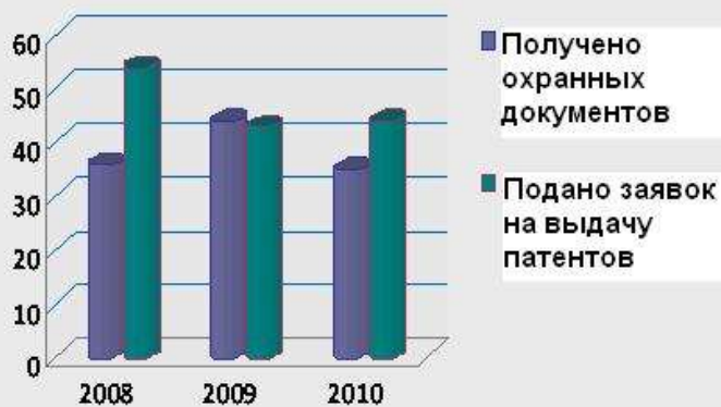
Количество полученных охранных документов

За три последних года получено 115 охранных документов на изобретения и полезные модели.