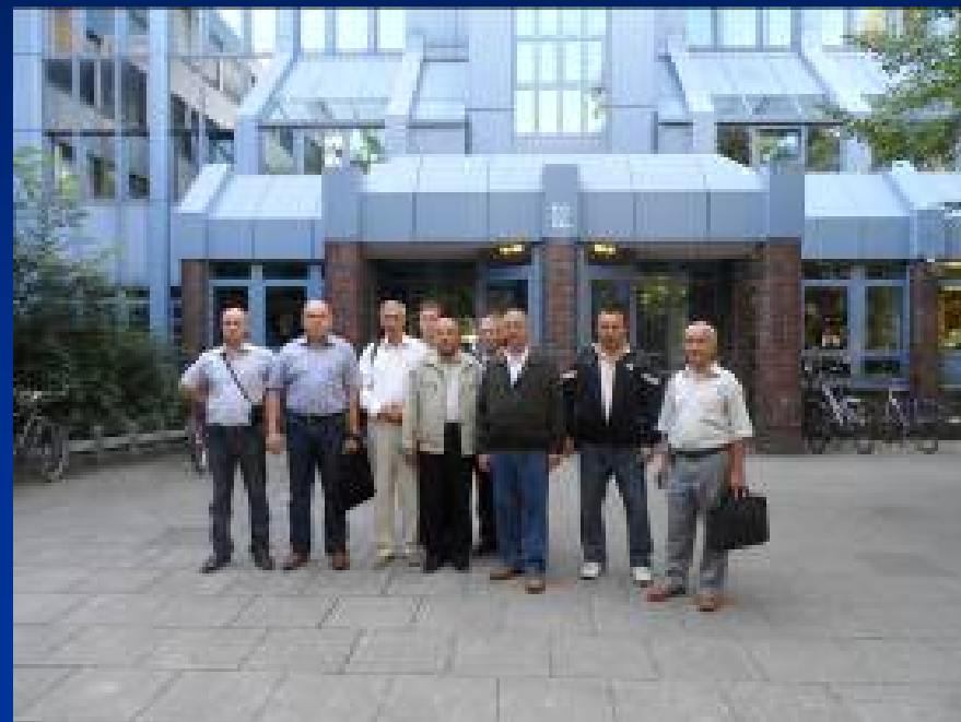
Участники от университетов Узбекистана