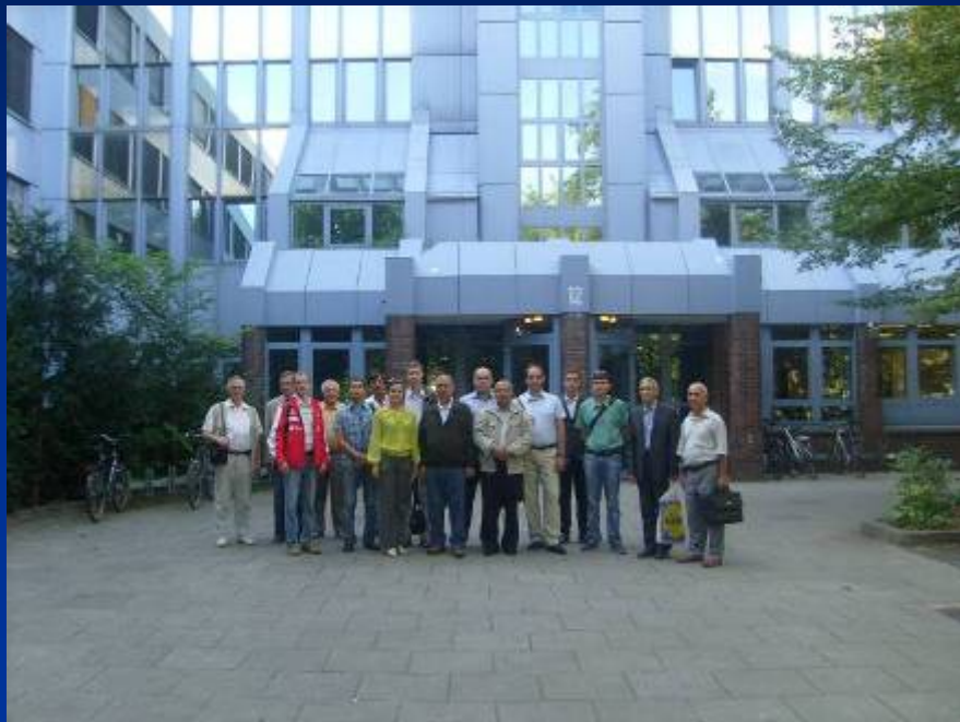
Участники от университетов России, Украины и Узбекистана